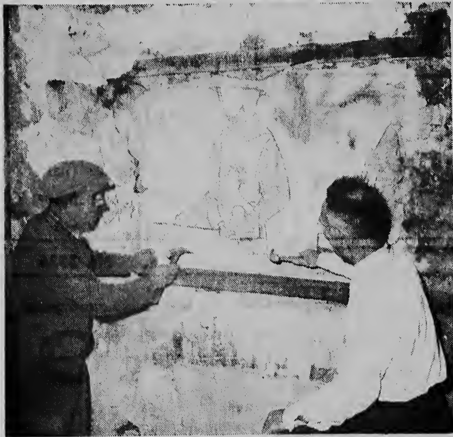
Kitando un copa di estuche for di muraya di un fabrica antiguo na Zutphen (Hulanda) algun pintura di fresco a sali na claridad, cu muy probable a wordepinta den siglo 15. Nan ta investigando si restauracion ta posibel ainda.